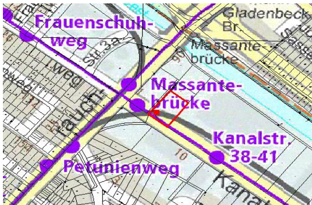
Standort und nahegelegener ÖPNV