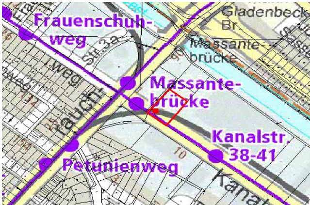
Standort und nahegelegener ÖPNV