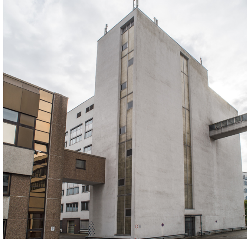
Abbildung 5: Außenansicht Produktionsgebäude