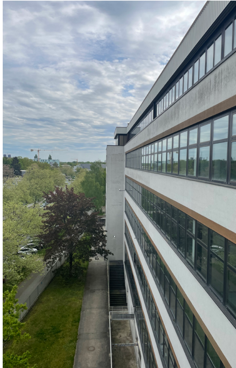
Abbildung 3: Straßenfront Verwaltungsbau

Nutzungen gem. § 11 Abs. 3 der Baunutzungsverordnung wie großflächiger Einzelhandel sind ausgeschlossen. Durch die räumliche Nähe zur Freien Universität Berlin und weiteren Forschungseinrichtungen ist der Standort auch für mit Wissenschaft und Forschung kooperierenden Firmen interessant. Die Gewerbeflächen eignen sich sowohl für Fertigung, angeschlossene Verwaltung, Forschung und Entwicklung, Vertrieb und Service.