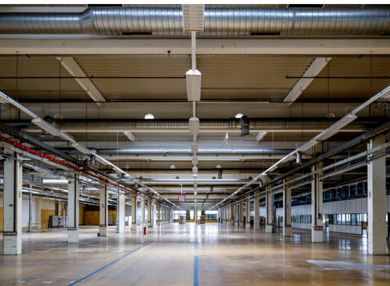
Abbildung 4: Innenansicht, Produktionshalle 1. OG

Laut Baugenehmigung können in dieser Halle bis zu 600 Arbeitsplätze eingerichtet werden. Die Tragfähigkeit der Decken liegt zwischen 8,2 KN/m 2 und 10 KN/m 2 . Die lichte Raumhöhe beträgt mehr als 5 Meter. Aktuell werden durch den Vermieter Herrichtungsmaßnahmen durchgeführt, sodass derzeit Mieterwünsche bezüglich des Ausbaus der Fläche teilweise berücksichtigt werden können. Ein Mieterausbau wäre parallel zu den Arbeiten des Vermieters ab 2025 möglich.