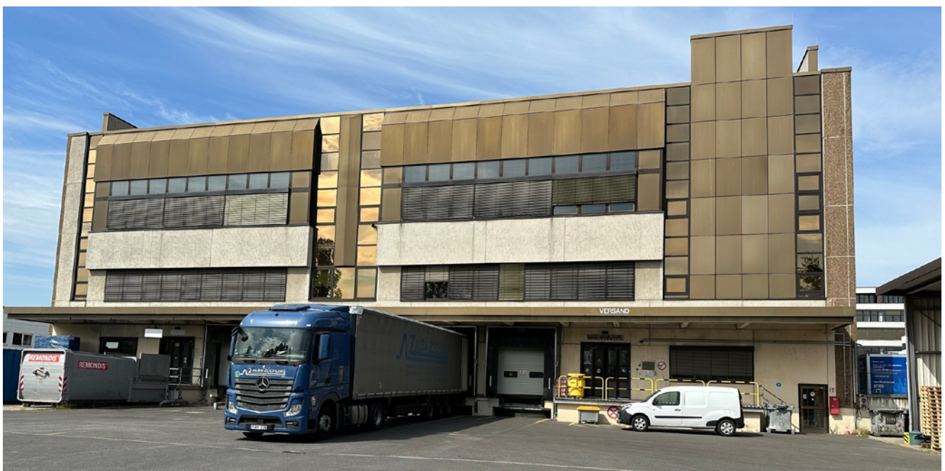
Abbildung 2: Außenansicht Produktionswerk, Anlieferungszone