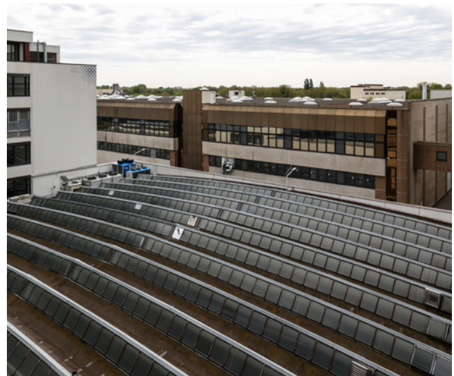
Abbildung 1: Shedhalle Verwaltungsbau, Blick auf Produktionswerk

Detaillierte Informationen zu den verfügbaren Flächen sowie weiteren Objektmerkmalen entnehmen Sie bitte dem Exposé auf unserer Homepage.