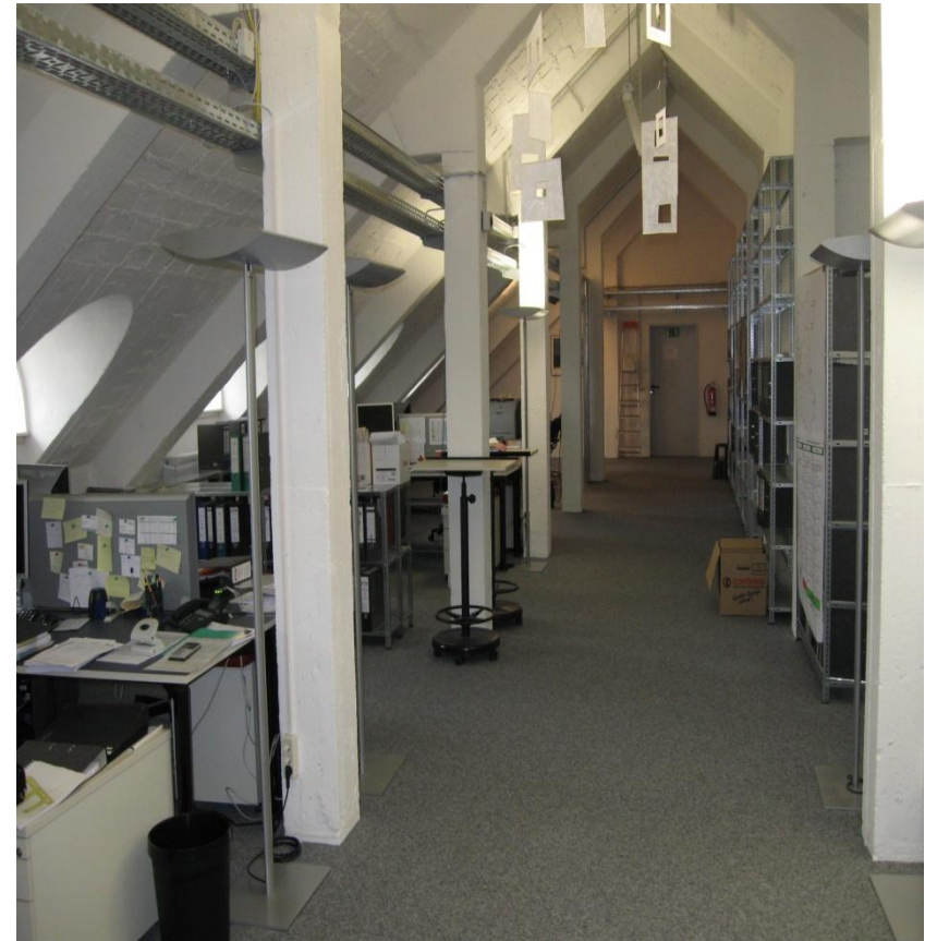
Vermietung der Fläche ohne Einrichtung