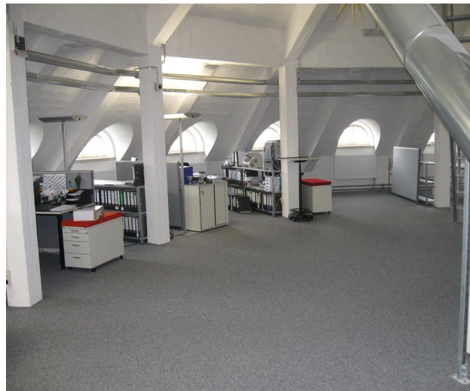
Vermietung der Fläche ohne Einrichtung