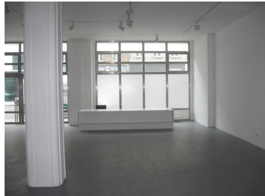
Blick zur großen Fensterfront, direkt an der Straße