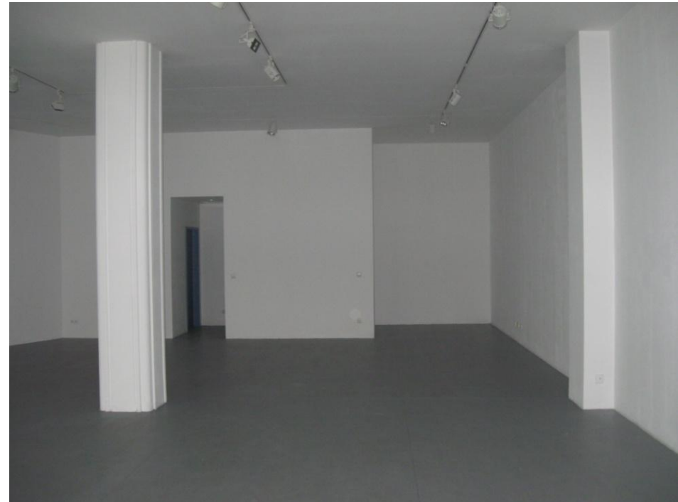
Blick in die helle und großzügige Galeriefäche